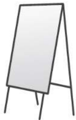
POTYKACZ 300 zł/miesiąc