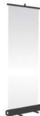
ROLL – UP 500 zł/miesiąc